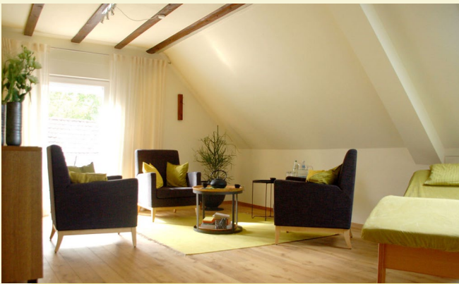
Räumlichkeiten zum Wohlfühlen